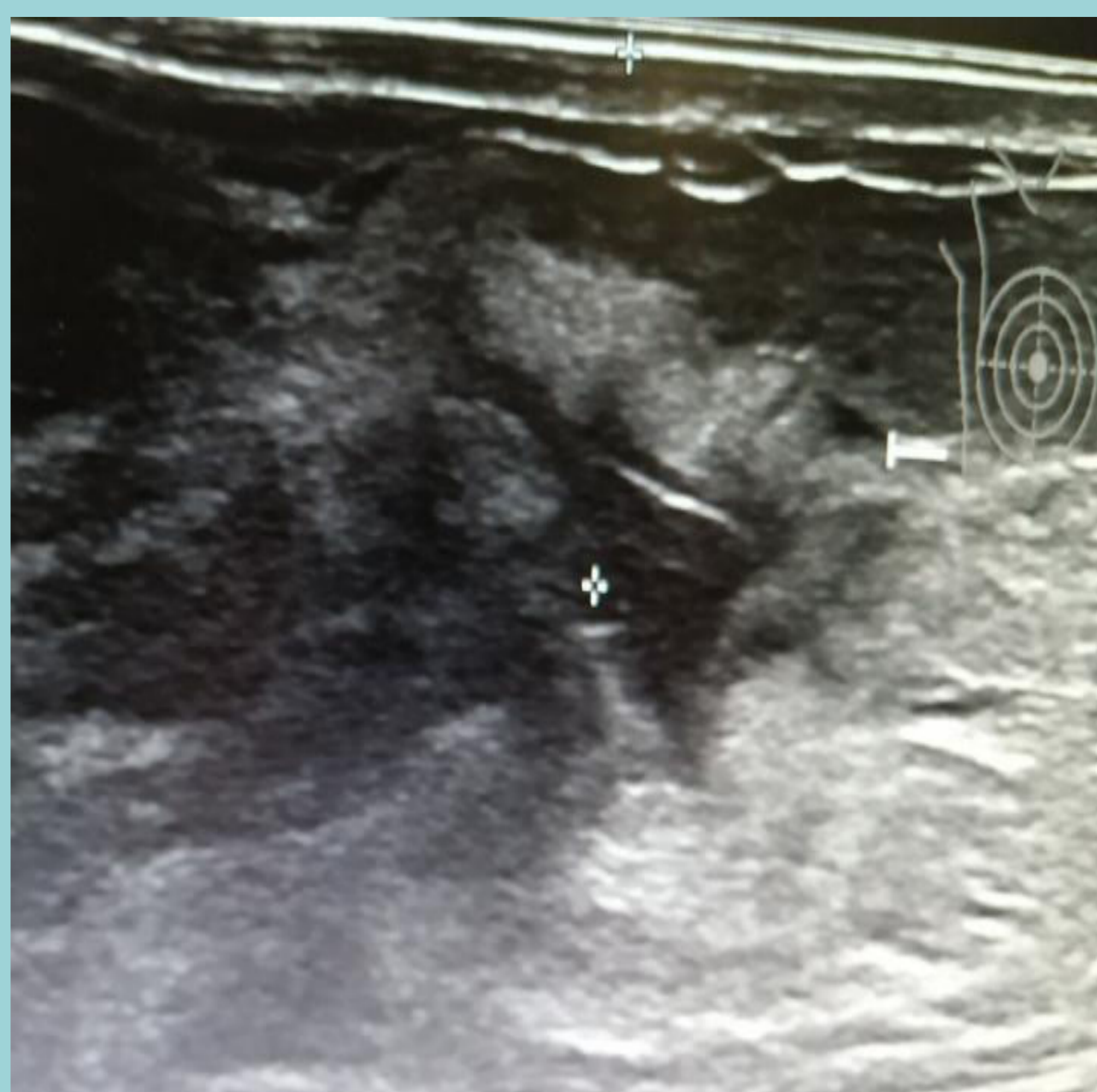
ECO previa del nódulo en CSI MD

□ Se decide ampliación de márgenes (BDA) el 21/11, cuya AP es negativa